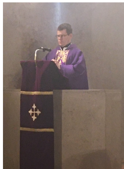
Proclamación del Evangelio

«La vida de los que en ti creemos, Señor, no termina, se transforma; y, al deshacerse nuestra morada terrenal, adquirimos una mansión eterna en el cielo. (Misal Romano, Prefacio de difuntos).