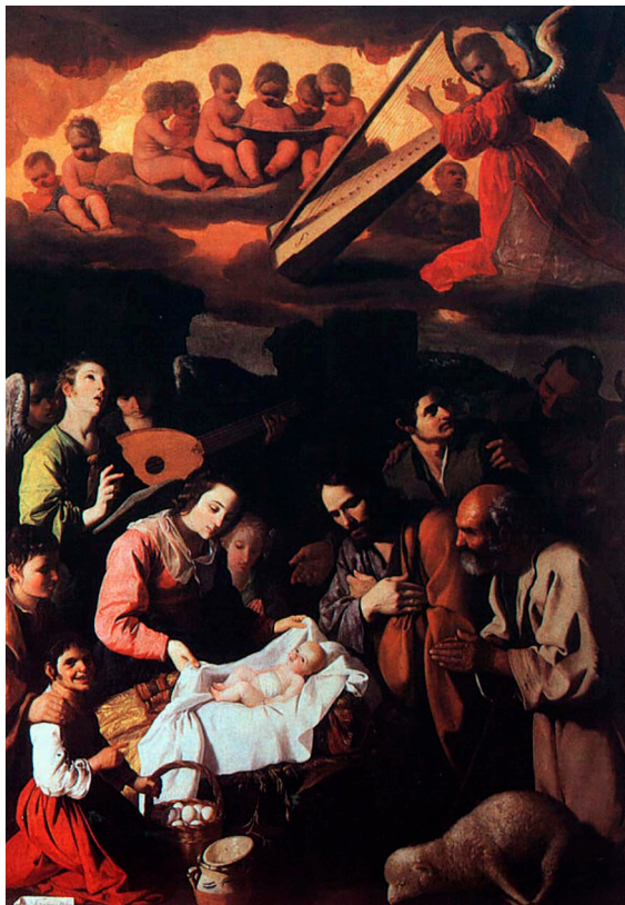
Francisco de Zurbarán (1598 - 1664)